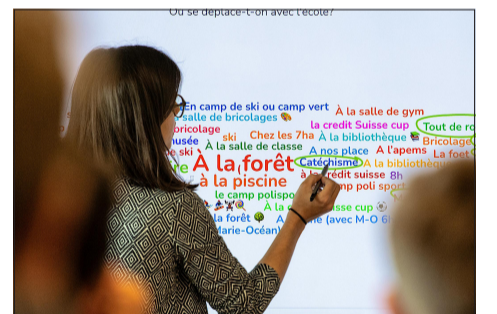
Dans l'établissement du Flon, des élèves de 2H ont ramassé et trié des déchets en forêt. Ceux de 5H à 7H se sont questionnés sur leur mobilité.